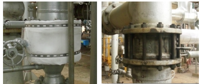
Válvula con y sin la instalación del protector del fuego y FIRESAFE®.