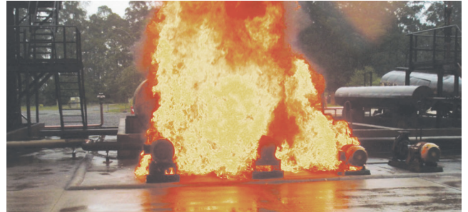
Los protectores fueron sometidos a la simulación de condiciones reales de incendio en planta Petroquímica.